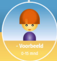
- Voorbeeld 0-15 mnd

Ontwikkeling - Los lopen - Mondgedrag - Melkvoeding - Voeding - Tandens poetsen - Verzorging -