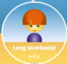
Leeg Voorbeeld 4-9 jr